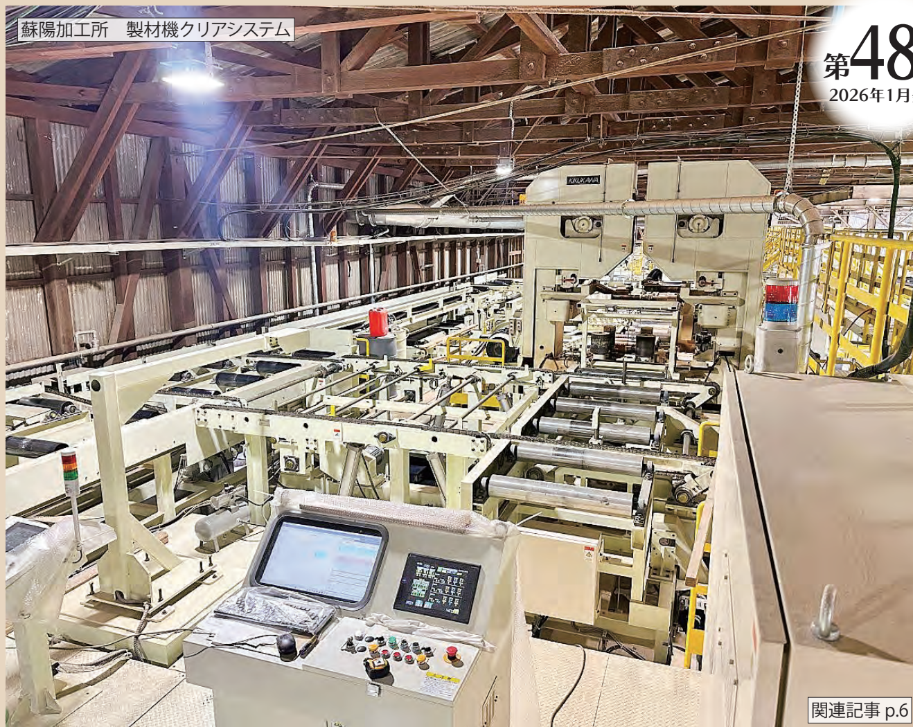
蘇陽加工所 製材機クリアシステム